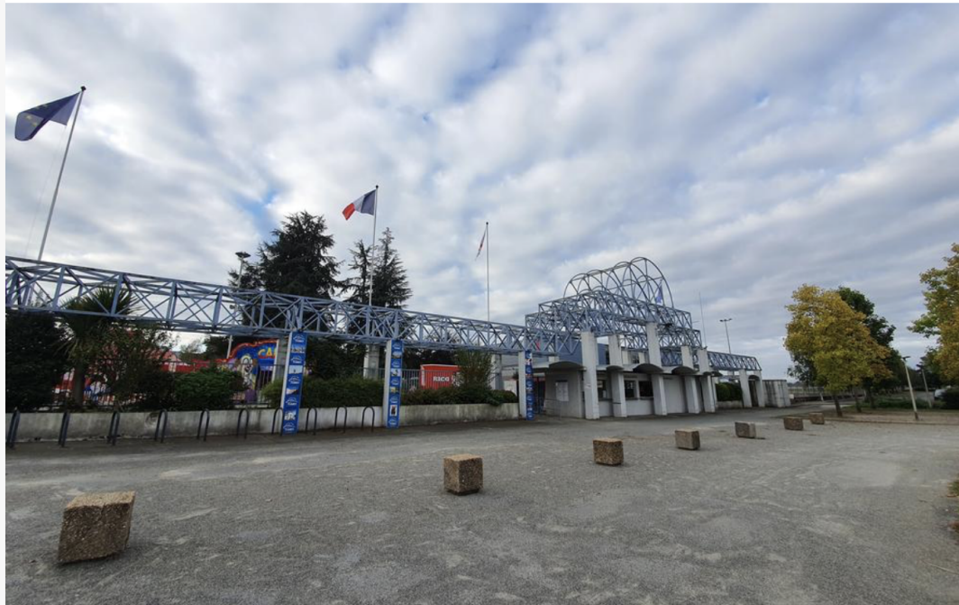
Les faits avaient eu lieu le 18 septembre 2021 devant le parc des expositions de Tarbes.

PUBLIÉ LE 23 JUIN 2025 À 15H50, MODIFIÉ À 20H12.