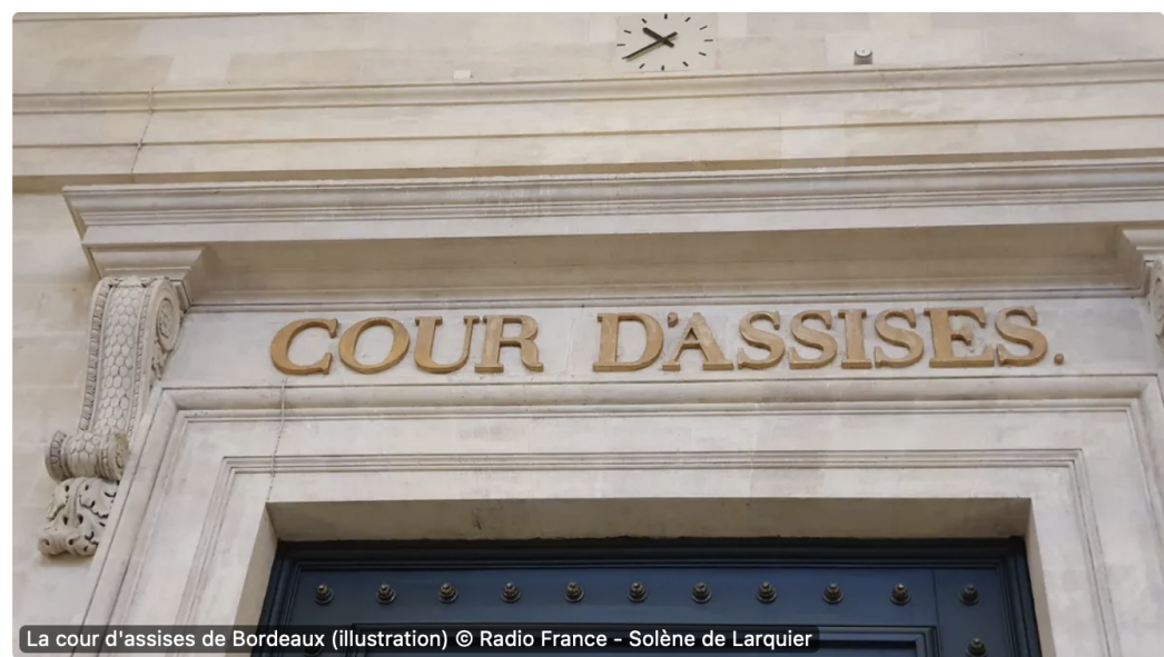
La cour d'assises de Bordeaux (illustration)