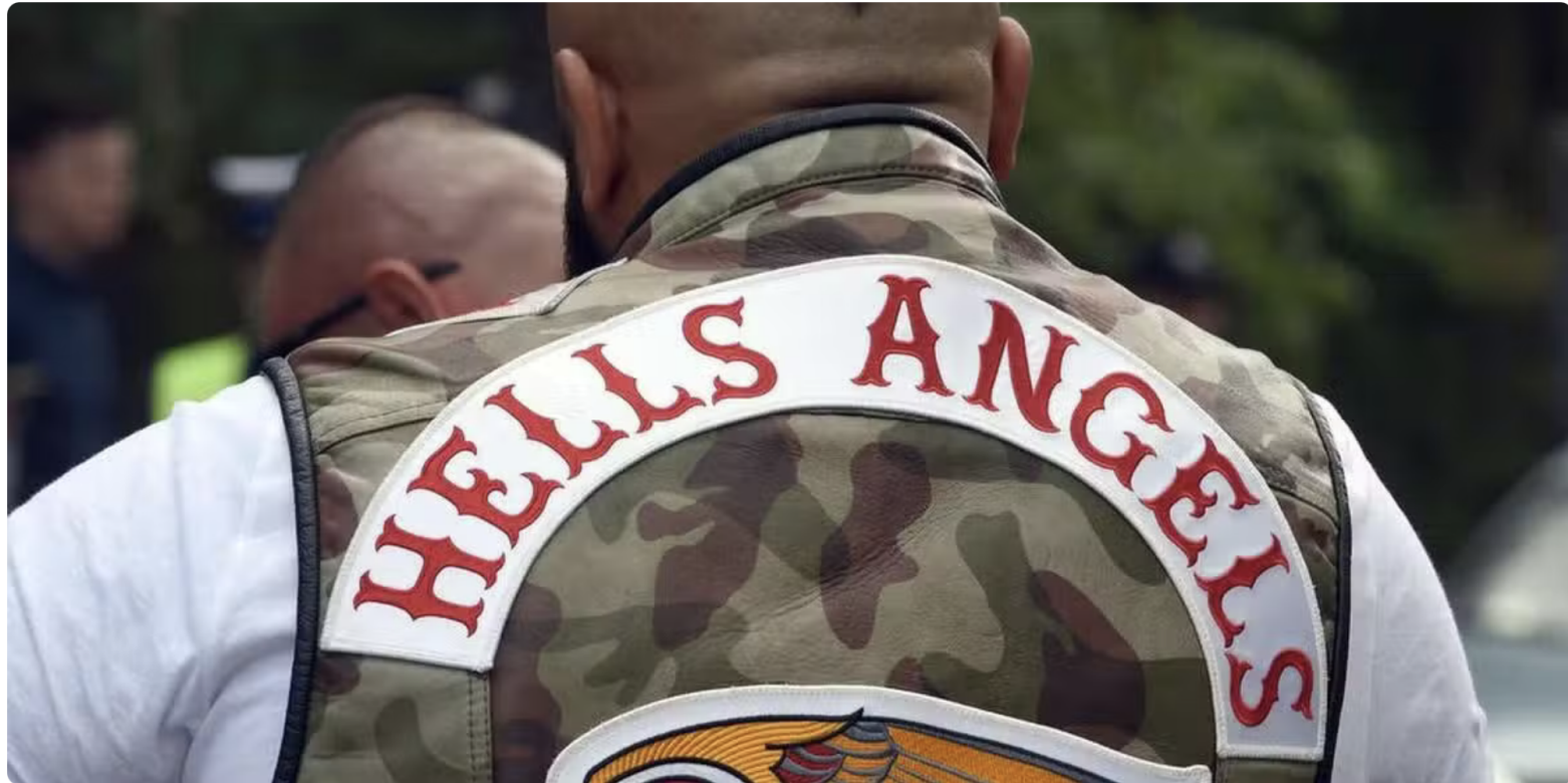
Les images montrent l'accusé porter plusieurs coups mortels à Joseph Pontroué alors que ce dernier, de dos à son agresseur, faisait face à plusieurs membres des Hells Angels. ©